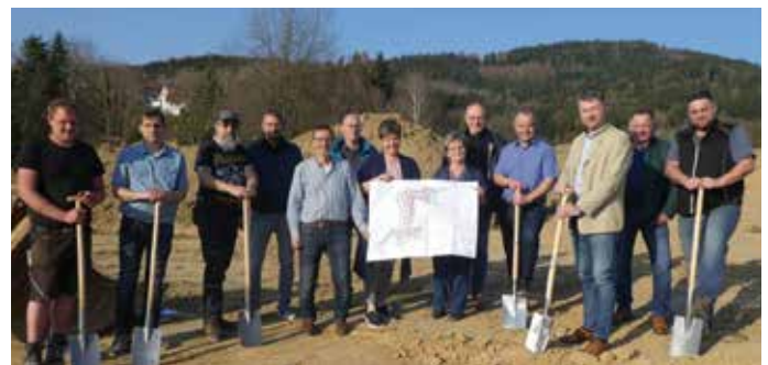
Spatenstich für die Erschließung Baugebiet Bühler Feld

Die Erschließung des neuen Baugebiets hat Ende März begonnen und soll bis September 2022 abgeschlossen sein. Somit können die Bauherren mit einer Bebauung ab Oktober 2022 planen.