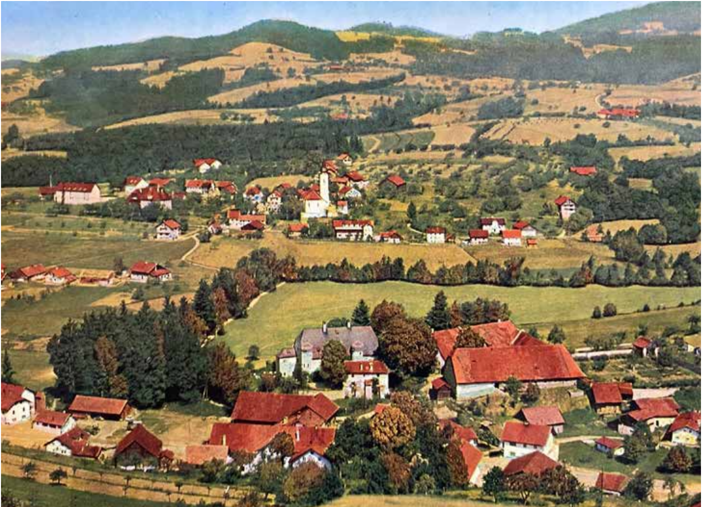
Altes Postkartenmotiv mit Schloss Haggn (untere Bildmitte)