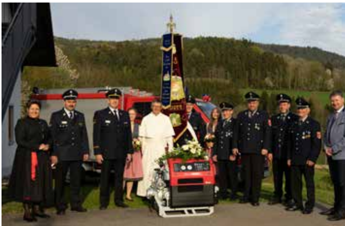
Pumpeneinweihung FFW Sparr am 23. April 2022