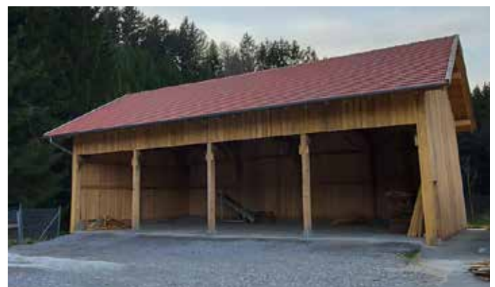
Der neue Stadl in Untermühlbach

Auf dem Bauhof in Neukirchen sind die Lagerkapazitäten beschränkt und erschweren unseren Mitarbeitern die Arbeit. Das hat auch zur Folge, dass viel im Freien gelagert werden muss, was keinen besonders guten optischen Eindruck hinterlässt. Aus diesem Grund hat der Gemeinderat beschlossen, auf dem Gelände der ehemaligen Kläranlage in Untermühlbach einen Stadl zu erstellen. Dieser wurde nun – auch mit viel Eigenleistung des Bauhofs – fertiggestellt und in Betrieb genommen. Der Stadl bietet nun genügend Fläche zum Unterstellen und Lagern.