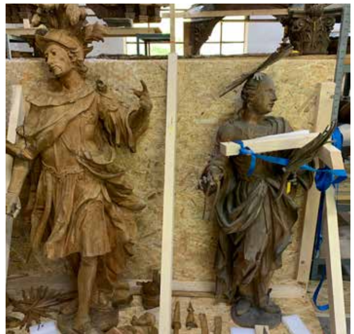
Der bereits gereinigte Hl. Florian. Die Hl. Ursula vor der Reinigung.

Weitere Arbeiten, die 2023 noch anstehen, sind der Rückbau der Gerüste im Innenraum, die Instandsetzung des Sakristeidaches, die Wiederherstellung der Stabilität der Altarmensa sowie die Erneuerung der aus den 1960er Jahren stammenden Elektrik.